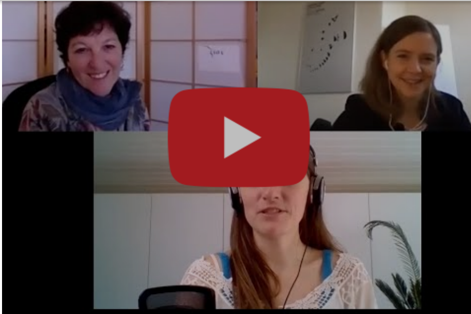
Interview über den Ursprung und das Potenzial von SEE Learning.